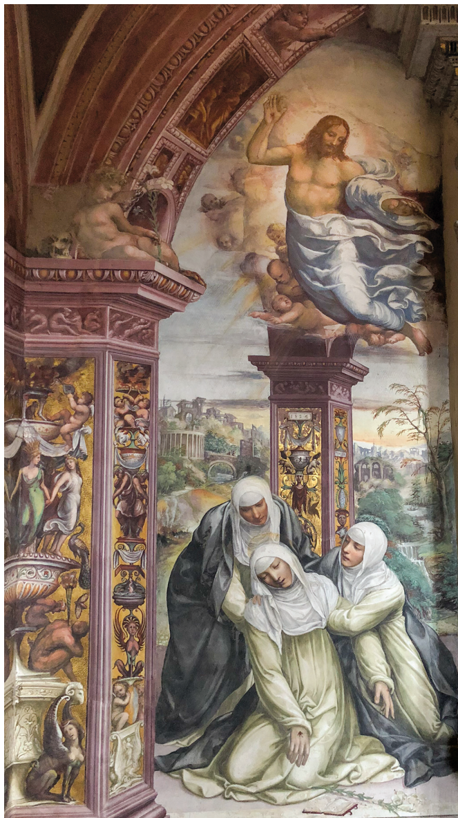
Giovanni A. Bazzi detto Il Sodoma: Cristo risorto ed estasi di santa Caterina (1526) Basilica di San Domenico - Siena

Da parte della Redazione a tutti i Lettori gli Auguri di una santa Pasqua nel Signore Risorto che ha vinto la morte e il peccato!